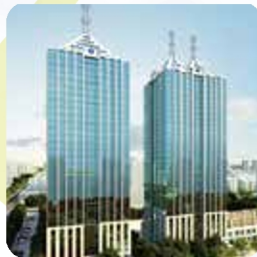
技尔(上海)商贸有限公司